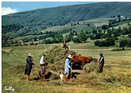
376 LA FENAISON