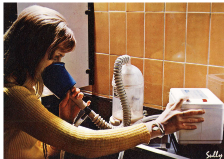
1829 Thermes du MONT-DORE Aérosol sonore