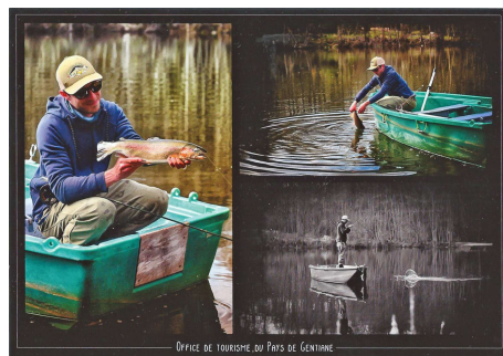
OFFICE DE TOURISME DU PAYS DE GENTIANE