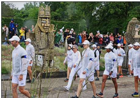
1 – A Cossé-le-Vivien (53) au Musée Robert Tatin

Voici trois cartes du passage de la flamme en Mayenne le 29.05.2024. Malheureusement, il pleuvait ce jour-là. Elles sont éditées par notre club (Club cartophile de Laval et de la Mayenne). Le photographe est Philippe Levillain.