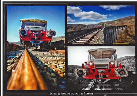
OFFICE DE TOURISME DU PAYS DE GENTIANE

Lac des Cascades Carte de la collection Pauline.B