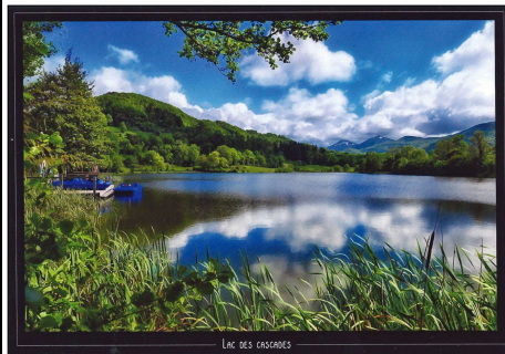
LAC DES CASCADES

Gilles BONNET 7 Rue des Meuniers 63170 AUBIERE