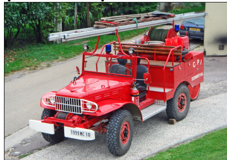
239 SP-SOMMEVAL (10) S.-P. de l'Aube. VPI aménagement local sur Dodge WC 52.