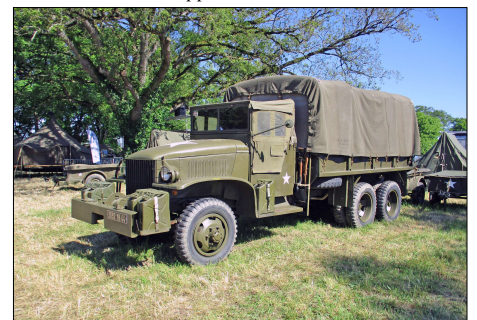
24 MIL-CASSON (44) GMC CCKW 353