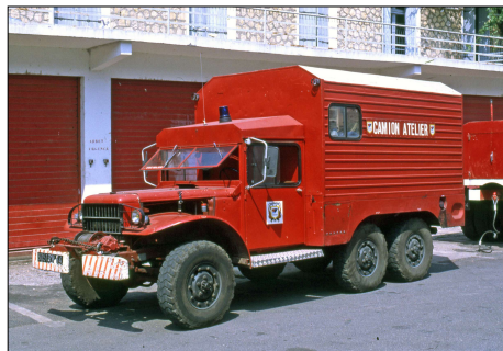
247 SP-SAINT-CHINIAN (34) S.-P. de l'Hérault. Dodge WC 63 camion atelier.