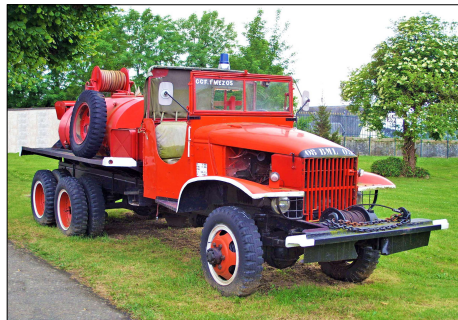
244 SP-NOGENT-LE-ROTROU (28) S.-P. des Landes. CCF GMC353 CCK.