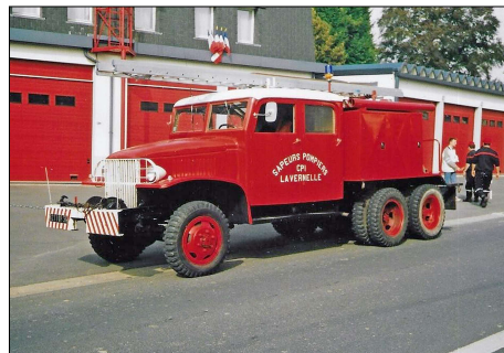
248 SP-VALENÇAY (36) S.-P. de l'Indre. CCF GMC CCKW 353 ex CIS La Vernelle.