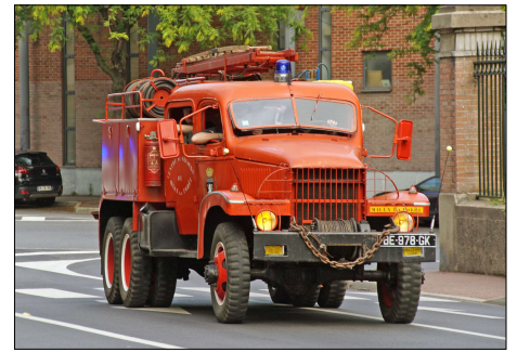
254 SP-CORBEIL-ESSONNES (91) S.-P. de l'Essonne. CCF Froger sur GMC CCKW 353.