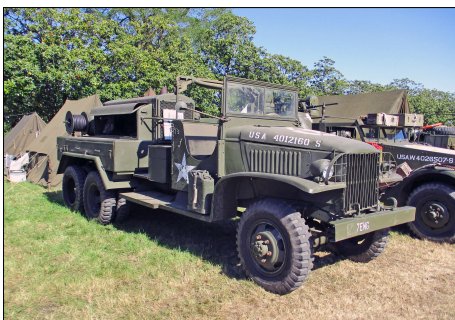
22 MIL-CASSON (44) GMC compresseur Leroi