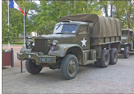
16 MIL-ISIGNY-SUR-MER (14) Diamond T 968 A.