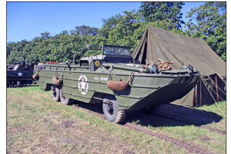
21 MIL-CASSON (44) GMC amphibie DUKW © Jean-Philippe BUNOUST-2024.