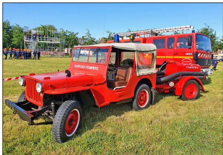
240 SP-AMFREVILLE (14) S.-P. du Calvados. VL HR Jeep Willys tractant une MPR© M, METIFEU-2022.