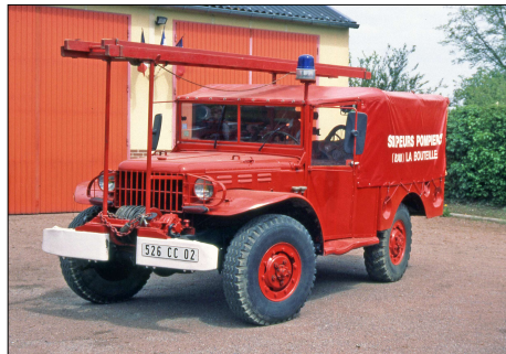
238 SP-LA BOUTEILLE (02) S.-P. de l'Aisne. VTU Dodge WC 52.