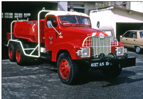
243 SP-MEYMAC (19) S.-P. de la Corrèze. CCF GMC 353 CCKW.