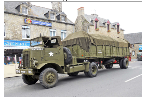
27 MIL-STE-MARIE-DE-MONT (50) Tracteur Fédéral avec une semi-remorque « Fiche 75 ».

Une CP nom reproduite : 17 MIL-ISIGNY-SUR-MER (14) GMC AFKWX 353.