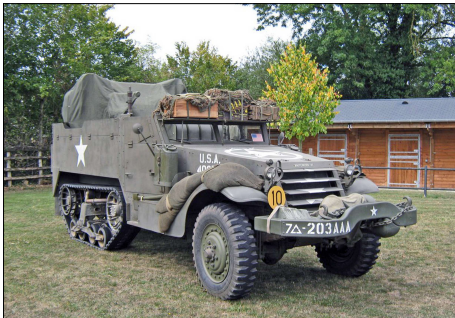
19 MIL-LA BAZOCHE-GOUET (28) Half-track M 16 de défense anti aérienne.