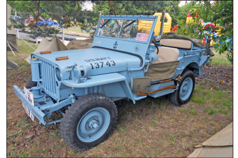
18 MIL-TOSNY (27) Jeep US Navy munie d'un cabestan.