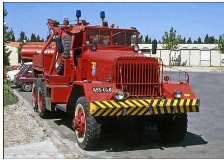
253 SP-PERPIGNAN (66) S.-P. des Pyrénées-Orientales. Camion de dépannage Ward.