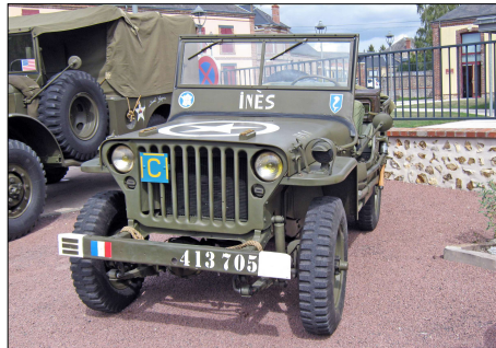
20 MIL-LA BAZOCHE-GOUET (28) Jeep restaurée aux couleurs de la 2ème DB. © Alain LESAUX-2019.