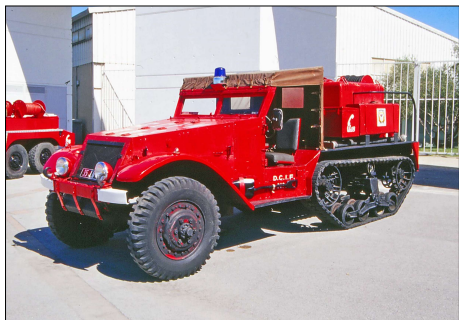
246 SP-PÉROLS (34) S.-P. de l'Hérault. CCF Half-Track ex CIS Lamalou-les-Bains.