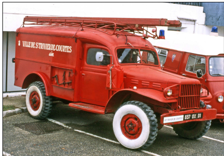
237 SP-BOURG-EN-BRESSE (01) S.-P. de l'Ain. VTU Dodge WC 54.