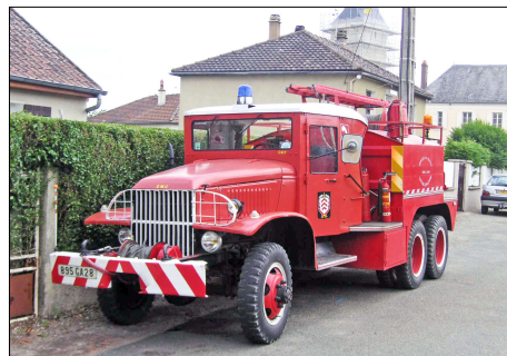
245 SP-NOGENT-LE-ROTROU (28) S.-P. d'Eure et Loir. CCF GMC353 CCKW.