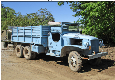
25 MIL-CASSON (44) GMC US Navy