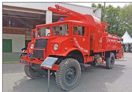
251 SP-VIGNEUX-DE-BRETAGNE (44) S.-P. de la Loire-Atlantique. VPI Chevrolet C 60L.

Série "Sapeurs-Pompiers 08/2024" : 18 CP franco de port: 20 € (France), 22 € (étranger) La carte au choix : 1,00 € + une enveloppe timbrée à votre adresse. (1 TP jusqu'à 3 CP, 2 TP au delà) Adresser votre commande à : Alain LESAUX 1 - Le Vignery 72110 PREVELLES Règlement par chèque ou virement SEPA : BIC : CMCIFR2A IBAN : FR76 1548 9048 0300 0655 8030 486