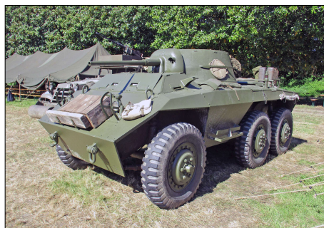
23 MIL-CASSON (44) Automitrailleuse Ford M 8 © Jean-Philippe BUNOUST-2024.