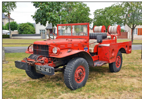
241 SP-DUN-SUR-AURON (18) S.-P. du Cher. CCFM Dodge WC 52