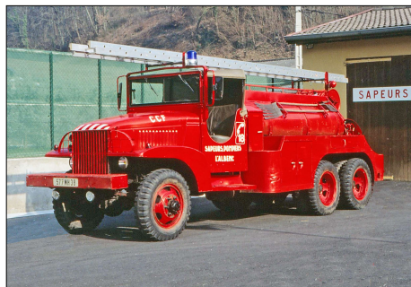
250 SP-L'ALBENC (38) S.-P. de l'Isère. CCF GMC CCKW 353.