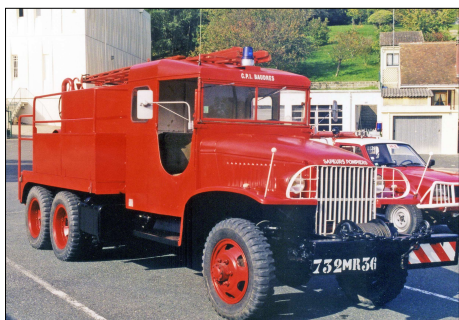
249 SP-VALENÇAY (36) S.-P. de l'Indre. CCF GMC CCKW 353 ex CIS Bardres.