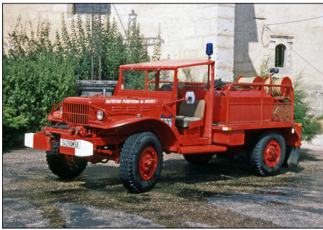
252 SP-BOUHY (58) S.-P. de la Nièvre. CCFM Dodge WC 52.