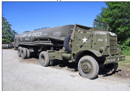
26 MIL-CASSON (44) Tracteur Fédéral avec une semi-remorque transport de carburant