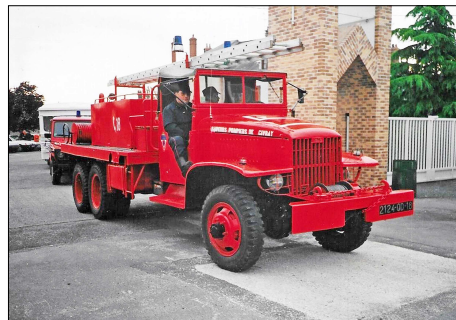
242 SP-VIERZON (18) S.-P. du Cher. CCF GMC 353 CCKW du CIS Civray.